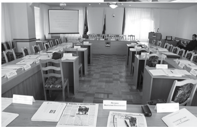
От того, кто войдет в этот зал хозяином после 13 сентября, будет зависеть благосостояние каждого жителя Орла.