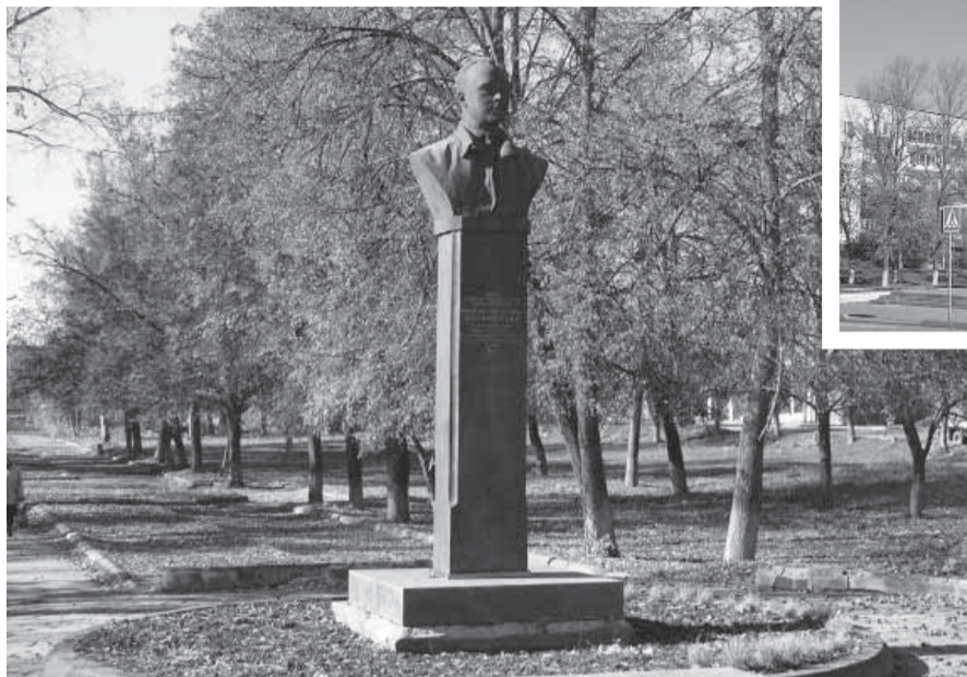
▲ В конце этой аллеи планируется строительство храма