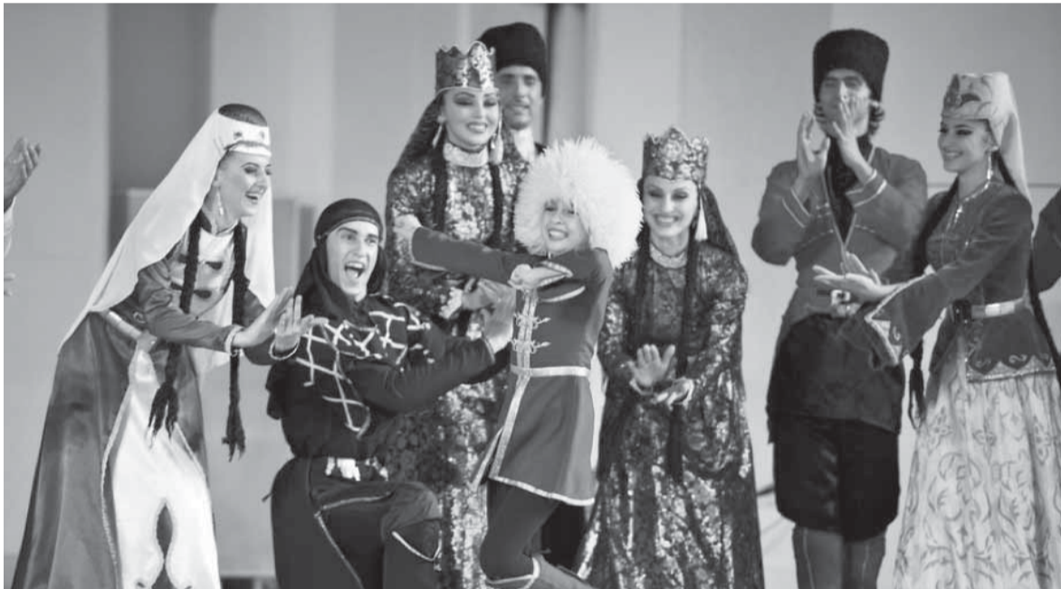
▲ Абхазский народный танец.

75-летний абхазец Кушнир, когда мы проезжали мимо пограничной заставы. С абхазским гидом, имеющим 39-летний стаж работы, нам повезло: его рассказ об Апсны был увлекателен, полон юмора и политкорректности. А также уважения к России и Путину, советскому прошлому и надежды на внимание к Абхазии с российской стороны. Никакого разыгрывания темы исторических обид абхазов на Россию и в помине не было. Наоборот! «Приезжайте сюда, возмните в аренду хоть эту бормашину здоровницу – сделаете хороший бизнес!» – горячо убеждал он туристов, сидящих в автобусе. Неодобрение в речи Кушнира если и скользило, то в виде сдержанных замечаний. Например, в адрес бывших грузинских президентов Гамсахурдия и Шеварнадзе, или американской вредительской бабочки, погубившей после Олимпиады ценнейший абхазский самшит; или Горбачёва, развалившего Советский Союз. Более жёстко, правда, он отзывался о грузинском правительстве, заявившем, что оно потеряло Абхазию. Но как можно потерять то, что никогда не было твоим? Тема интернационализма у пожилого абхаза была ключевой. Он вспоминал, как во вре-