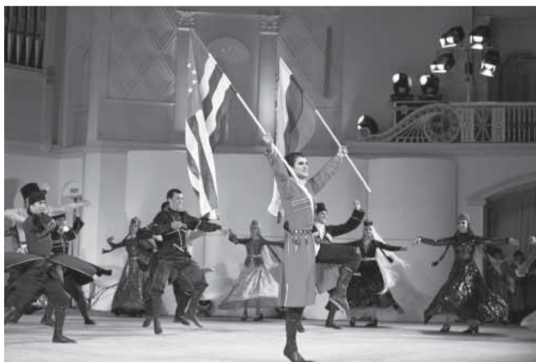
▲ На сцене дворца культуры.

Церкви в Абхазии строились уже тогда, когда на месте будущих Нотр-Дама, Исаакия и Кёльнского собора ещё шумели дремучие леса, и язычники в шкурах возносили кровавые жертвы духам... В 1874 году сюда прибыли русские монахи из греческого Афона и основали монастырь, названный Ново-Афонским Симоно-Кананитским. Золотые купола привлекают внимание каждого проезжающего по трассе на Сухум. Монастырь как бы висит над городом и над миром, осеняя и защищая их своей мощью. Архитектурный ансамбль гармонично вписан в