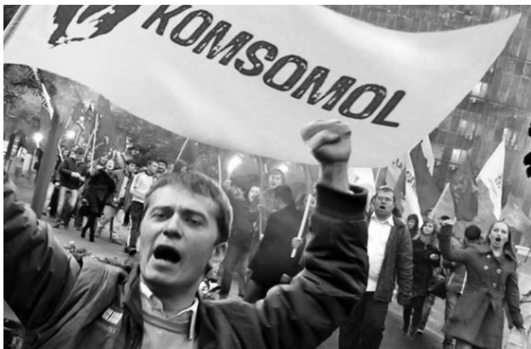
• Борьба с националистами в Молдавии.

В 1994 году я переехал в Ливны, но в Кишинёве оставалась мама, и я на каникулах ехал туда. Здесь же были все мои товарищи, уже получившие опыт борьбы за свои права. Война в Приднестровье и захват власти националистами способствовали ранней политической зрелости мальчишек и девчонок того поколения. Я был свидетелем, как в Кишинёве на митинге на площади Ленина в окружении националистов выступил коммунист. Его буквально сшибли и нанесли смертельные ранения, он впоследствии умер. Мы видели, что интересы русскоязычного населения и простых трудящихся защищает только Компартия. Поэтому в 1996 году я и несколько моих школьных товарищей вступили в Партию Коммунистов Республики Молдова (ПКРМ). Мне ещё не исполнилось 17 лет, но устав партии позволял принимать молодёжь. В революционное время – слово за молодёжь. Способствовал этому шагу