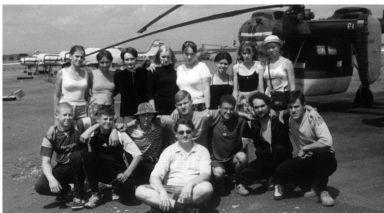
• Ливенская комсомольская делегация на слёте в Пугачёвке. 2001 г.