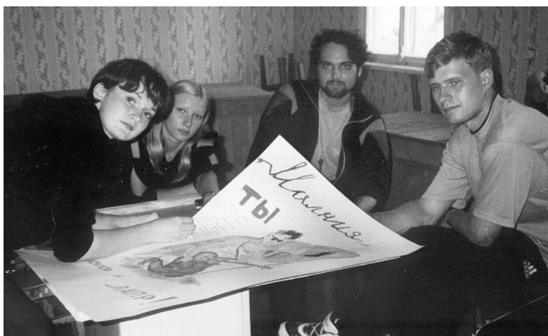
• Коллективное творчество.