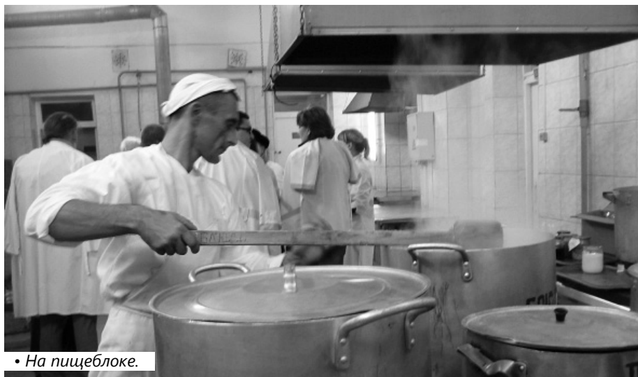
• На пищеблоке.

В больнице также находятся больные с ВИЧ-инфекциями и гепатитами. У первых чаще всего диагностируют туберкулёз. Пациентов регулярно осматривает врач-инфекционист. Лекарства для ВИЧ-инфицированных выделяются по федеральной программе. К больным приходят специалисты из областных медицинских учреждений. При необходимости их направляют в областную противотуберкулёзный диспансер. Заключено соглашение с областной больницей, которая принимает больных осуждённых, консультирует их.