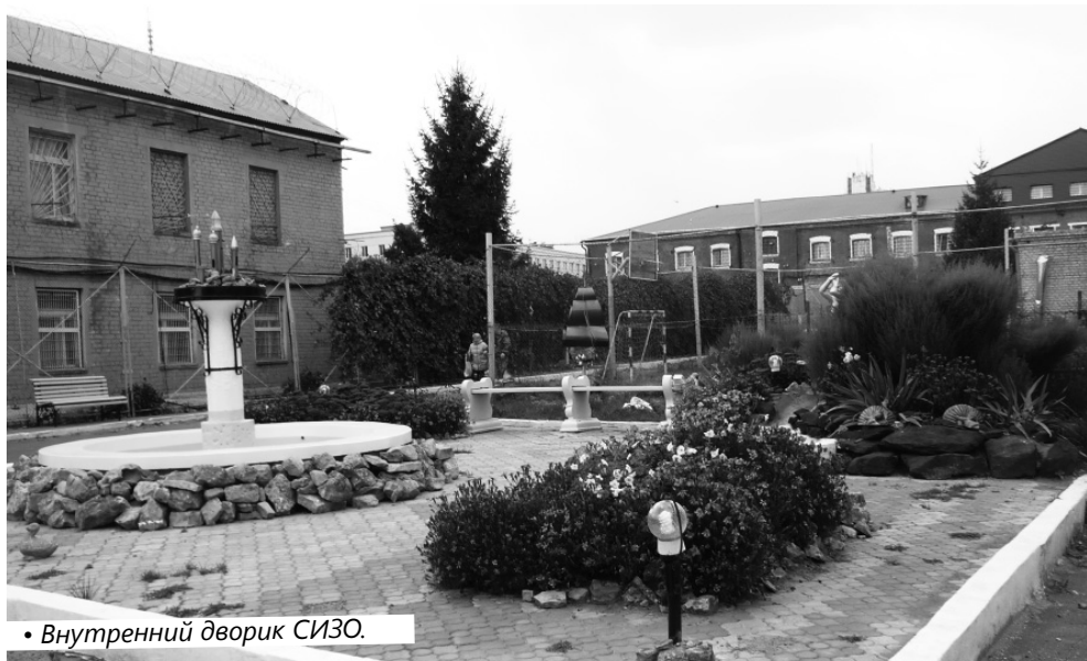
• Внутренний дворик СИЗО.

Р усская поговорка гласит: «От сумы да от тюрьмы – не зарекайся». Статистика подтверждает эту поговорку: Россия занимает одно из первых мест в мире по числу осуждённых. Сегодня в местах лишения свободы находится более миллиона россиян. Эту часть общества мы можем списать со счетов, ссылаясь на другую русскую поговорку: «Горбатого могила исправит». А можем поддержать.