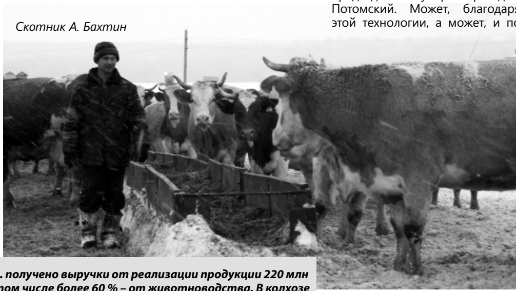
Скотник А. Бахтин

В 2015 г. получено выручки от реализации продукции 220 млн руб., в том числе более 60 % – от животноводства. В колхозе трудятся 170 работников. Средняя зарплата по итогам года составила 28,4 тыс. руб. с ростом к уровню предыдущего года на 12 %, в том числе заработная плата доярок – 34 181 руб., телятниц – 28 964 руб., свинок – 28 309 руб., трактористов – 33 163 руб.